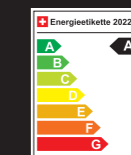
Abb. Eclipse Cross PHEV Diamond, Energieverbrauch Strom 24.2kWh/100km, Normverbrauch Benzin 2.0l/100km; CO 2 -Emission gesamt 46g/km; Energieeffizienz-Kategorie A. Bis zu 55km rein elektrische Reichweite (City).