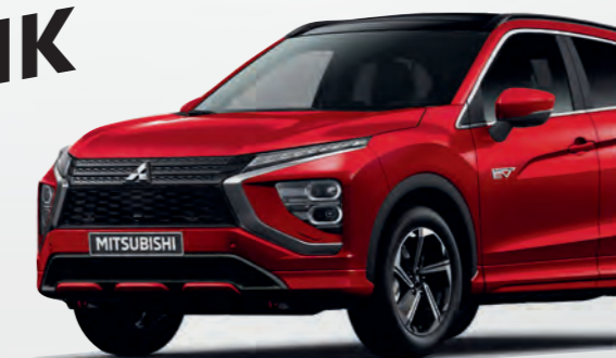
MITSUBISHI ECLIPSE CROSS PHEV

KRAFTVOLLE DYNAMIK TRIFFT AUF ELEGANTES DESIGN